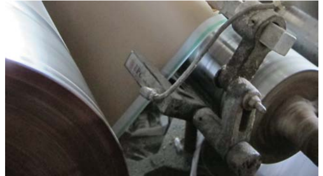
Kızılötesi Sensör DS-26L iç kenar pozisyon control üzerinde kullanılmaktadır.