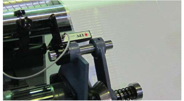
Kızılötesi Sensör DS-26L ekstrüzyon Laminasyon üzerinde kullanılmaktadır.